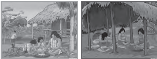
Láminas de pueblos amazónicos