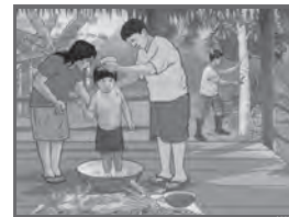
Lámina del pueblo afroperuano