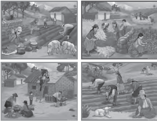
Pueblo Originario Quechua Central