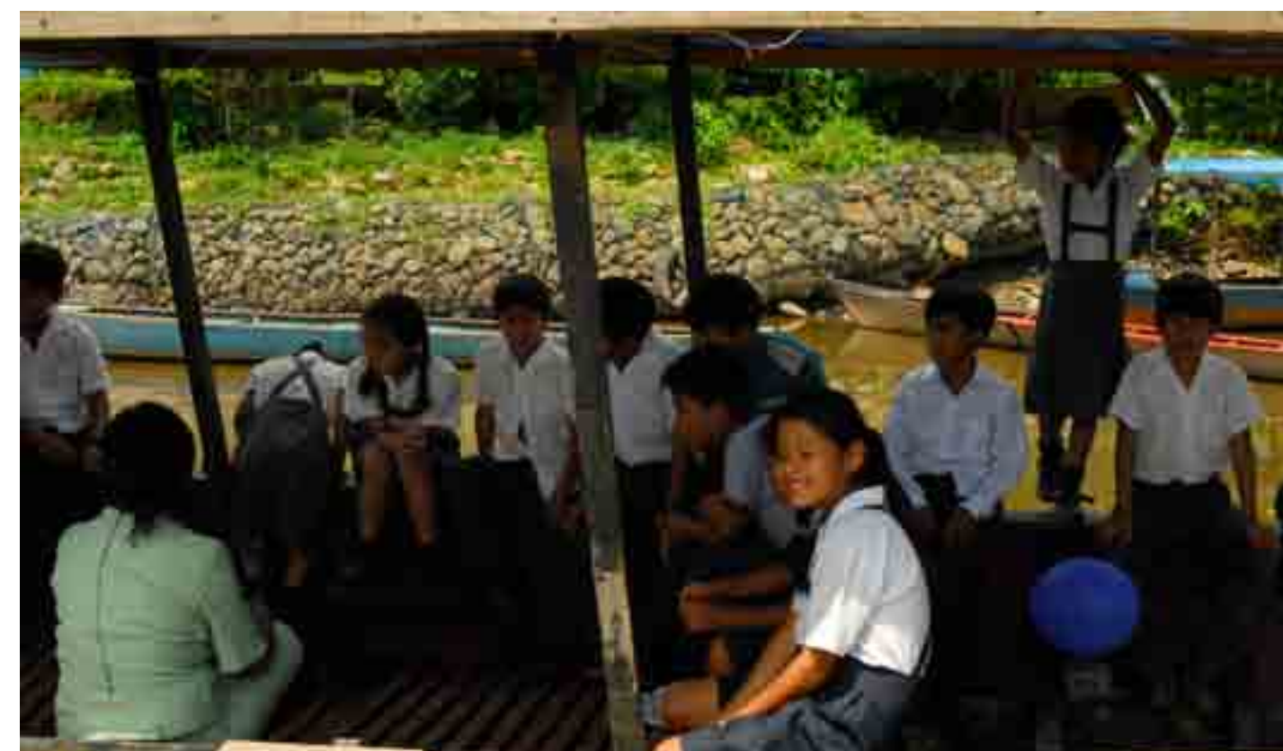
Raúl Egúsqiza / Niños del Milenio

En este boletín primero hacemos una revisión somera sobre las normas vinculadas a la EIB. Luego describimos los resultados relativos al empleo y actitudes de las lenguas nativas obtenidos durante la encuesta escolar. Finalmente discutimos, a modo de conclusión, las perspectivas para la EIB.