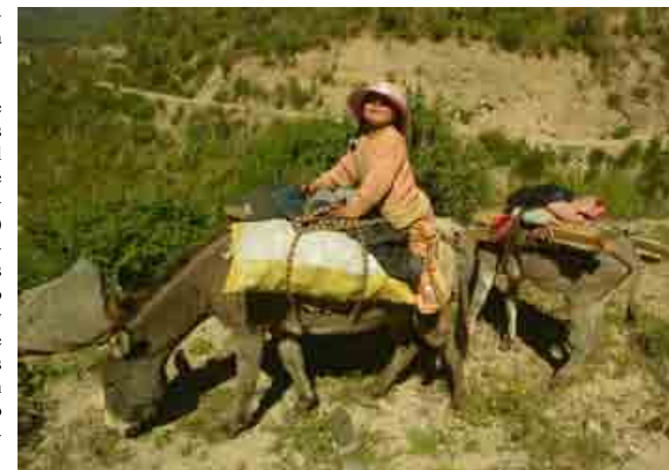
Sebastián Castañeda / Niños del Milenio

De la mano con el poder político, se requiere también que las instituciones representativas de la sociedad civil (centros de investigación, ONG que trabajan temas de justicia, democracia, derechos, ciudadanía, entre otros) incorporen en sus agendas y sus prioridades, el tema de desarrollo de las lenguas originarias del Perú, que no solo atañe a los pueblos indígenas y sus organizaciones –las mismas que ya vienen luchando desde hace años por este desarrollo–, sino que es un asunto de país, de verdadero ejercicio de derechos de todos y todas, de verdadera democracia y ciudadanía.