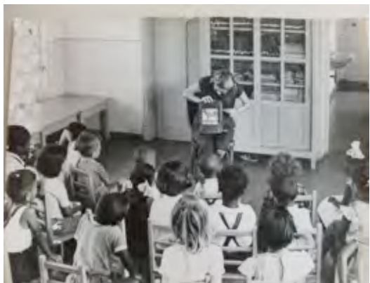
03. Fotografia do arquivo da pré-escola-I – s/d.

expôs a existência de um passado capaz de estruturar o presente através de crenças e sentimentos coletivos partilhados (GIDDENS, 2005).