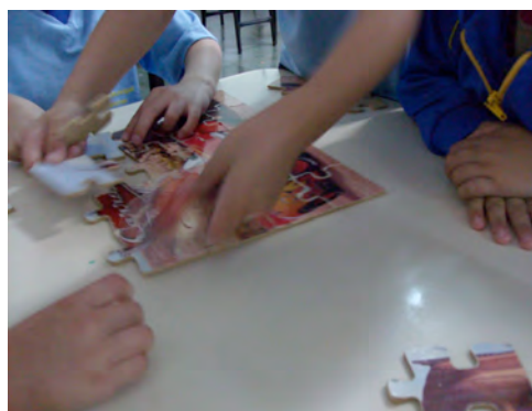
15. Quebra-cabeça temático – 20/08/2009.