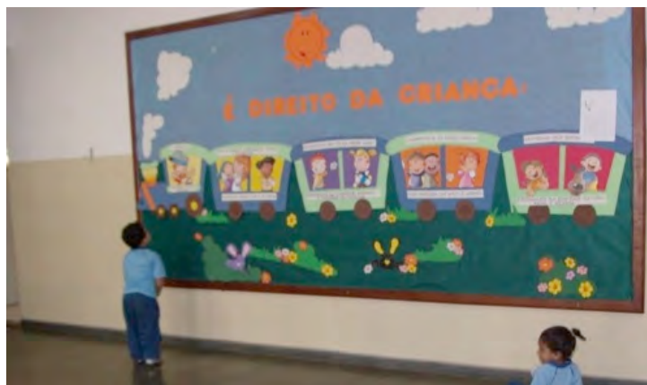
08. Salão principal da pré-escola – 14/10/2009.

Esse mural chamava a atenção das crianças e, por diversas vezes, foi possível observá-las conversando entre si a respeito das figuras, ou mesmo vê-las passar as mãos sobre os desenhos para sentir a textura e o relevo 25 (figura 08).