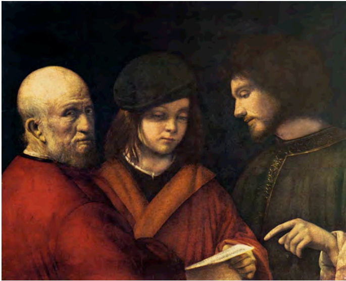
Giorgione. As três idades . 1500. Galleria Palatina. Florença, Itália.