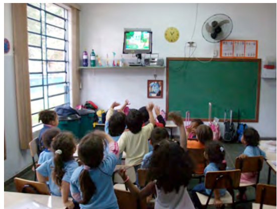
09. Panorâmica de um dos lados da sala de atividades – 10/06/09.

A sala do grupo pesquisado era menor em comparação às demais, e não comportaria adequadamente 25 crianças caso o grupo estivesse completo 27 . O espaço era bem iluminado e arejado com três grandes janelas, pelas quais as crianças conseguiam ver o lado de fora. Havia três ventiladores, dois fixados no teto e outro na parede. Em uma das paredes estava fixada uma televisão, sob a qual havia uma prateleira onde ficavam os aparelhos de DVD e de som – com CD, rádio e toca-fitas. Ao lado dessa prateleira estava o quadro de giz e, à frente, um grande banco sobre o qual as crianças deixavam seus pertences (figura 09).