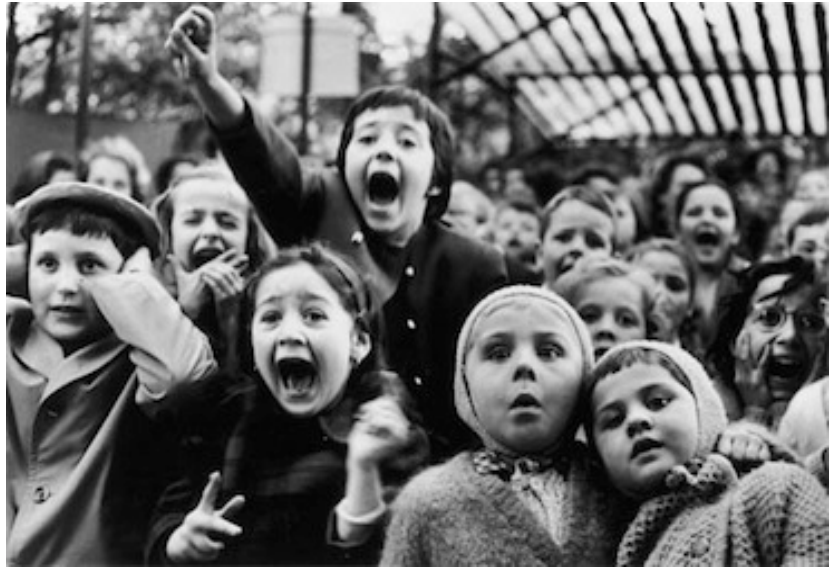
Alfred Eisenstaedt. Crianças em um teatro de fantoches. Paris, 1963.