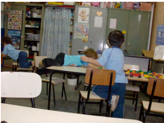
10. Panorâmica do outro lado da sala de atividades – 22/07/09

Pelas paredes da sala estavam expostos o alfabeto, os números cardinais de zero a nove, um painel de livros, um calendário e varais nos quais os trabalhos plásticos eram pendurados. Encostados à parede do fundo da sala ficava o mobiliário da professora – os armários e, à frente deles, uma escrivaninha e uma cadeira. Enfim, estavam distribuídas pela sala sete mesinhas com quatro cadeiras cada, sendo que todas eram proporcionais ao tamanho das crianças (figura 10).