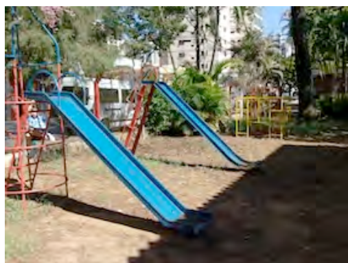
05. Paisagem do parque da pré-escola-I – 31/08/2009.

Toda área construída estava cercada por alambrados, o que permitia ver os parques da pré-escola e da creche a partir da via pública. A parte externa da pré-escola era grande e bem aproveitada, contava com diversos brinquedos, um campo de futebol adequado às crianças pequenas e um tanque de areia protegido com telas por todos os lados. O parque tinha o formato da letra L, sendo que na parte menor havia dois escorregadores de metal, um carrossel e um brinquedo de plástico com escorregador, túnel e escadas (figuras 05 e 06).