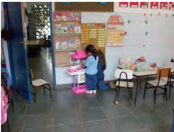
11. Brincadeira da casinha – 14/09/2009.

As figuras 11 e 12 representam o modo binário como as coisas do mundo foram apresentadas às crianças. As professoras, de modo persistente, indicavam que havia alguns produtos, brinquedos, roupas, comportamentos, palavras e gestos destinados para as meninas, outros para os meninos e outros ainda para ambos.