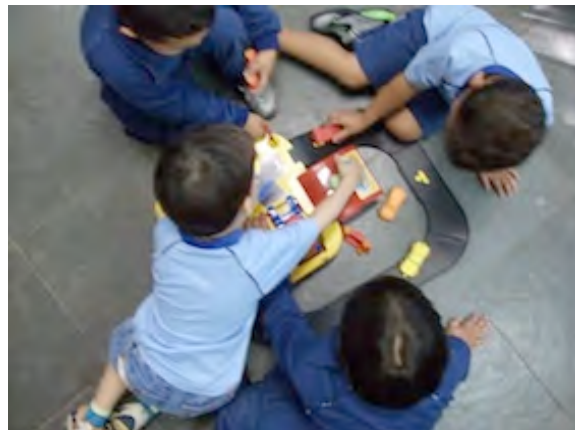
12. Brincadeira de carrinho – 21/10/2009.

A categorização e a polarização acerca do masculino e do feminino foram apresentadas para as crianças algumas vezes de forma sutil e outras de forma direta. Por exemplo, foi com sutileza que as professoras usaram termos como força e coragem para os meninos e, para as meninas, delicadeza e fragilidade.