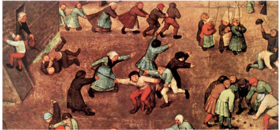
Pieter Brueghel, o Velho. Jogos de crianças (detalhe). 1559-60. Kunsthistorisches Museum. Viena, Áustria.