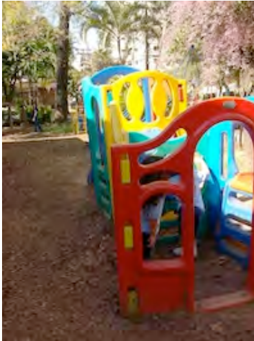
06. Paisagem do parque da pré-escola-II – 31/08/2009.

Na outra parte ficavam o campo de futebol, dois tanques de areia e brinquedos de metal e madeira como trepa-trepa, escorregadores, gangorras e uma casinha suspensa com escadas, escorregador e ponte pênsil. No centro dessa área havia uma grande árvore de copa muito larga, a qual oferecia nos dias de verão uma ótima sombra. Próximo ao alambrado, havia ainda outras árvores e arbustos (figura 07).