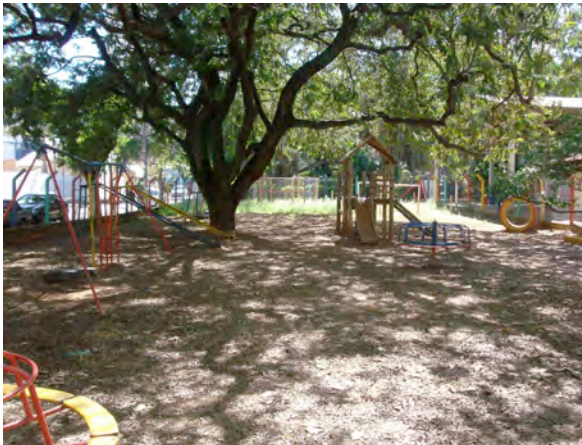
07. Paisagem do parque da pré-escola-III – 31/08/2009.

Na outra parte ficavam o campo de futebol, dois tanques de areia e brinquedos de metal e madeira como trepa-trepa, escorregadores, gangorras e uma casinha suspensa com escadas, escorregador e ponte pênsil. No centro dessa área havia uma grande árvore de copa muito larga, a qual oferecia nos dias de verão uma ótima sombra. Próximo ao alambrado, havia ainda outras árvores e arbustos (figura 07).