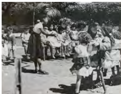
04. Fotografia do arquivo da pré-escola-II – s/d.

No ano de 2009, a pré-escola atendeu as crianças nos períodos matutino e vespertino – ao todo seis turmas formaram esse segmento, sendo três turmas em cada período – com aproximadamente 180 crianças matriculadas. A EMEI dividia espaço – terreno e construção – com o Centro Municipal de Educação Infantil – CEMEI 23 . Eram duas construções planas, independentes e com entradas distintas. Uma construção era específica para a creche; quanto à outra, acomodava seis turmas de pré-escola e um grupo da creche.