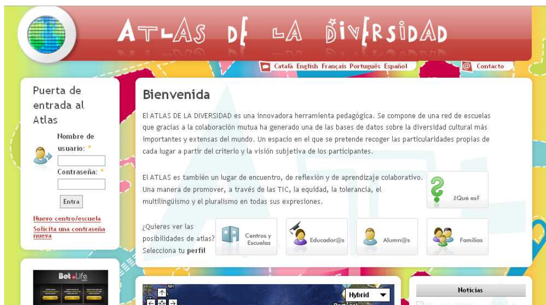
IMAGEN 1 CAPTURA DE PANTALLA PÁGINA PRINCIPAL ATLAS DE LA DIVERSIDAD