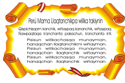
Coro del Himno Nacional