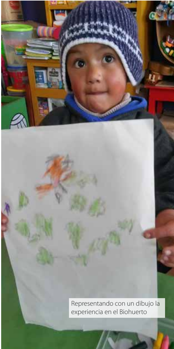
Representando con un dibujo la experiencia en el Biohuerto

Las experiencias en el biohuerto son una oportunidad para que se integren capacidades de diferentes áreas en la programación. A diferencia de años anteriores, en que la planificación se organizaba a partir de los contenidos que la docente priorizaba, bajo esta nueva concepción, los contenidos y capacidades se planifican a partir de la actividad significativa.