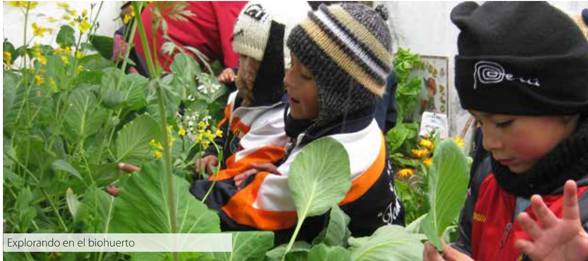
Explorando en el biohuerto

En esta línea, Barrón Ruiz (*) define al aprendizaje por descubrimiento como actividad de resolución de problemas, que requiere, al igual que la indagación, de la comprobación de hipótesis como centro lógico del acto de descubrimiento.