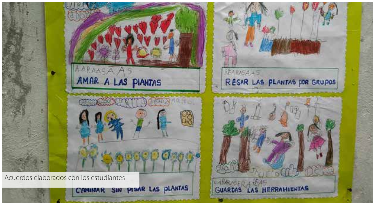
Acuerdos elaborados con los estudiantes

Sin embargo, la manera como el niño ejerce su autonomía o cómo se comunica va a depender del progresivo desarrollo de sus capacidades. Las niñas y niños de 5 años, usarán con mayor fluidez la comunicación verbal, mientras que para los niños menores se expresarán mediante el gesto o el dibujo para comunicar sus ideas e intereses. Las responsabilidades que asuman las niñas y niños variarán de acuerdo a su edad así como los tiempos de atención para cada actividad.