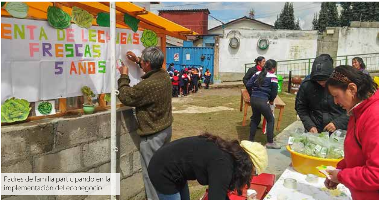
Padres de familia participando en la implementación del econeocio

El éxito de una alianza estratégica requiere de un diálogo y entendimiento constante entre padres y docentes para llegar a este consenso, pero es necesario que las docentes construyan, como un elemento básico, una relación de respeto y confianza mutua, con claridad en las responsabilidades de cada uno. Las docentes deben de combinar en este sentido, la sensibilidad y empatía, la amabilidad y calidez en el trato, con la firmeza y asertividad para exigir el cumplimiento de las responsabilidades asumidas.