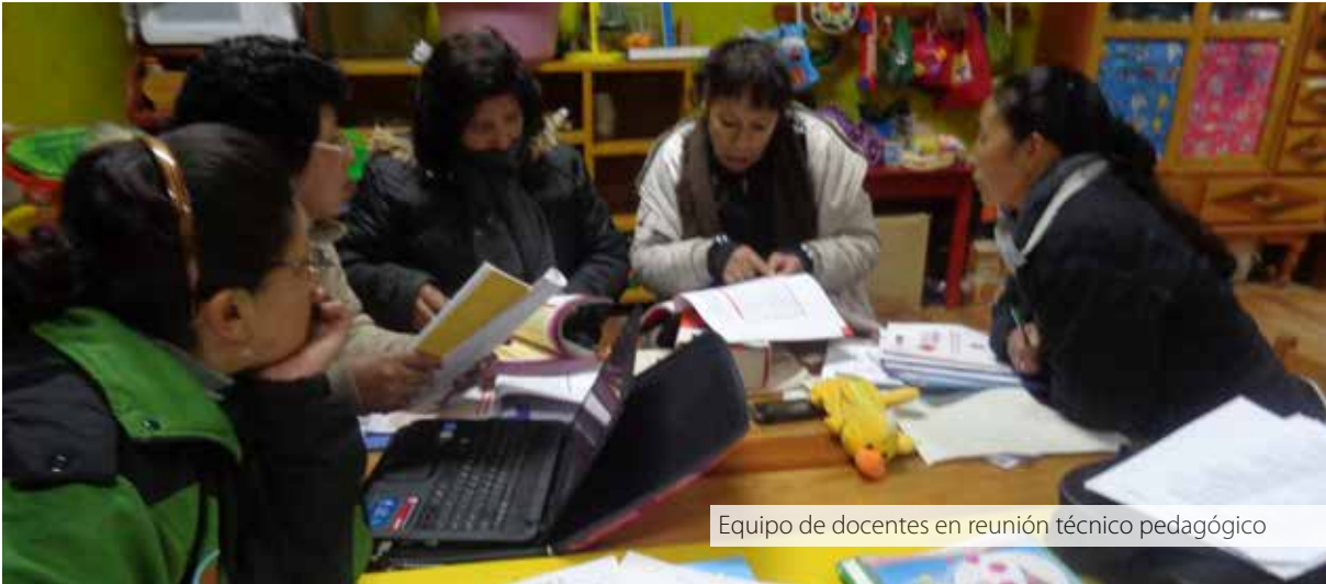
Equipo de docentes en reunión técnico pedagógico

...y yo me preguntaba también pero porque de un momento a otro despertó esta IE y es justamente una de ellas es el clima institucional, o sea cuando uno visita este jardín de niños existe un clima institucional armonioso. (Entrevista personal. Especialista de la Dirección Regional de Pasco. 29 de abril de 2015).