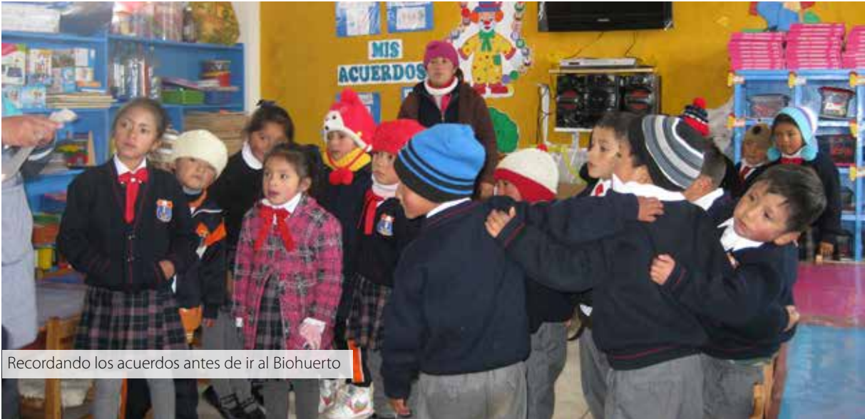
Recordando los acuerdos antes de ir al Biohuerto