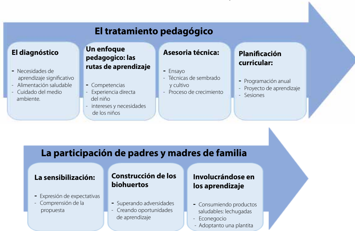
Gráfico N° 1 - Procesos transversales de la experiencia