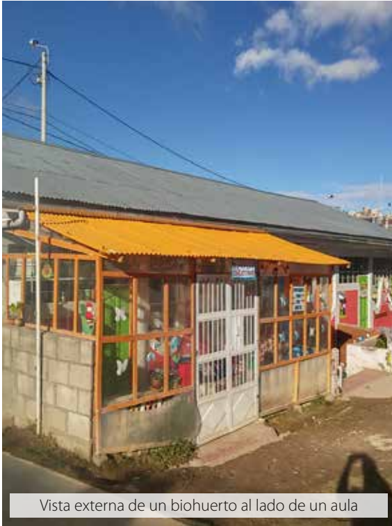
Vista externa de un biohuerto al lado de un aula

En un inicio, la directora comienza la implementación de un biohuerto y, a manera de ensayo, siembra algunas plantas a fines del 2013 y, a inicios del 2014 ya crecen las primeras plantas. Esto es un elemento motivador para las demás docentes que expresan su emoción al ver crecer las plantas en medio del clima árido que caracteriza a la región, para varias de ellas fue la primera vez que observaban este fenómeno natural.