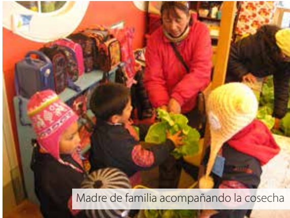
Madre de familia acompañando la cosecha