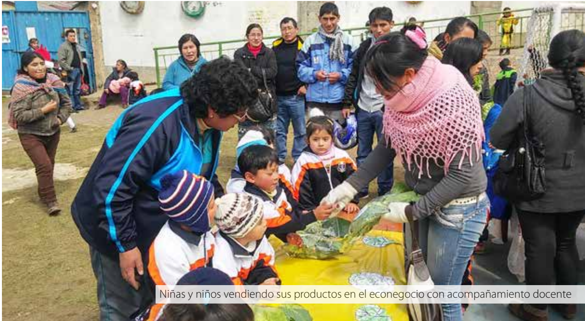
Niñas y niños vendiendo sus productos en el econegocio con acompañamiento docente

La formulación de preguntas reemplaza al tradicional rol de explicar o presentar contenidos acabados, siendo una herramienta fundamental para guiar la indagación y el aprendizaje por descubrimiento.