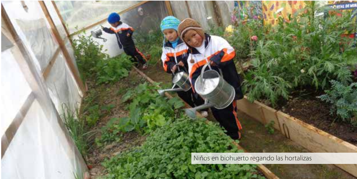
Niños en biohuerto regando las hortalizas