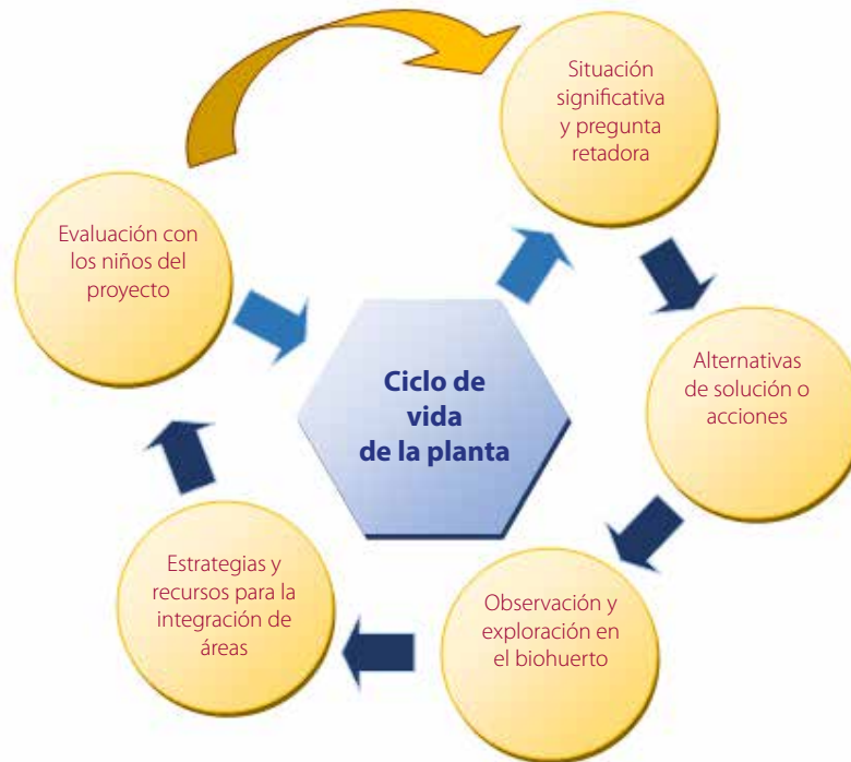
Gráfico N° 05: La ruta metodológica para la indagación guiada