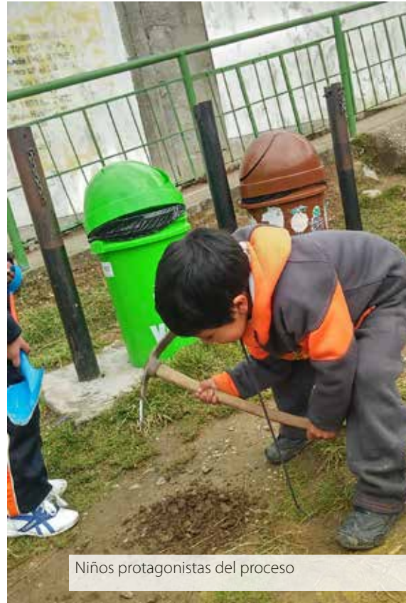
Niños protagonistas del proceso

En este sentido, los acuerdos o normas de convivencia no deben de ser herramientas para controlar el comportamiento de niños y niñas, sino más bien una herramienta que promueva su autonomía a partir de la comprensión de la finalidad de los mismos y la progresiva autorregulación en su cumplimiento.