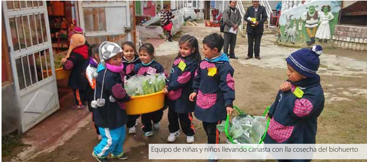
Equipo de niñas y niños llevando canasta con la cosecha del biohuerto