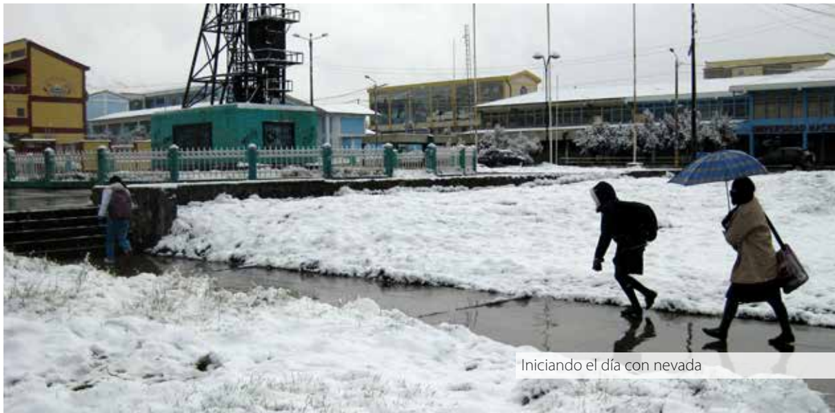
Iniciando el día con nevada

Debido a las bajas temperaturas que se presentan durante el año, el paisaje es árido y, en el distrito sólo se observa el árbol llamado Quinual/Qeña, una de las pocas especies que crecen soportando estas extremas temperaturas.