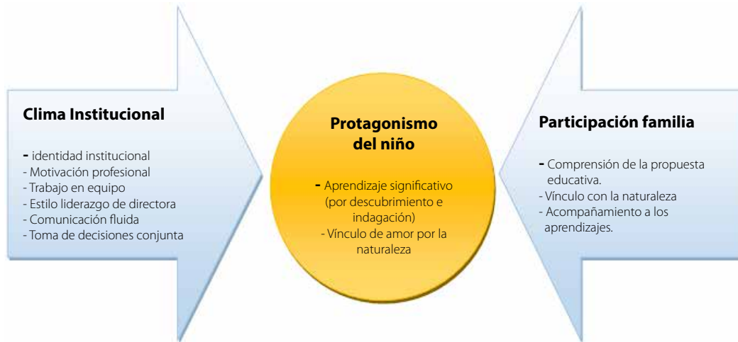
Gráfico N° 2 - Acercándonos al corazón de la experiencia