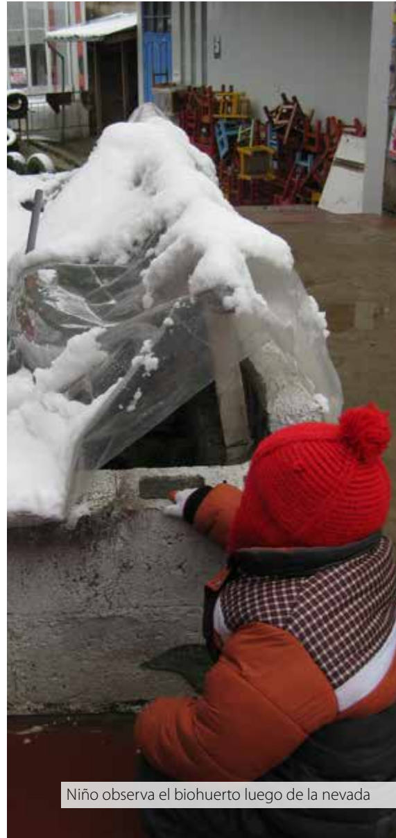
Niño observa el biohuerto luego de la nevada

...cuando queríamos enseñar las partes de la planta, antes tradicionalmente todo era con láminas, inclusive preparábamos con corrospún, con plásticos, primero la raíz, después armábamos, al final salía una planta, pero no era algo natural pues, era algo dibujado elaborado, que no es lo correcto.