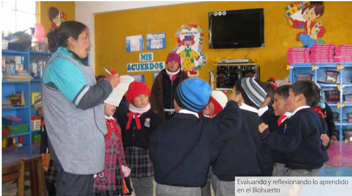
Evaluando y reflexionando lo aprendido en el Biohuerto

Al término del proyecto ya debemos evaluar, tenemos un día para evaluar con los niños. Por ejemplo, si teníamos para visitar en este proyecto de la familia: "¿se cumplió visitar a la familia tal?". Los niños: "Si hemos ido Miss". Lo que no se cumplió, también se ve por qué no se cumplió. (Entrevista grupal con docentes de la institución educativa. 28 de abril de 2015)