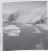
Una zona de cultivo de papa en el Perú.

La economía peruana muestra día a día, pero nuestro medio ambiente está deteriorándose cada vez más. Ríos y aire contaminados, suelos salinizados, actividades que no ofrecen los beneficios necesarios para una vida digna, especies en extinción... ¿Qué son algunos de los problemas que enfrenta el Perú en la actualidad? ¿Qué acciones debemos tomar para tener el desarrollo económico de nuestro país?