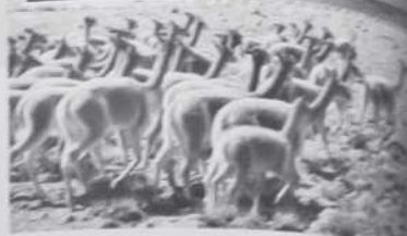
Un rebaño de ovejas en el Perú.

¿O ME PREGUNTO? ¿Por qué es importante combinar la protección del medioambiente y el crecimiento económico?