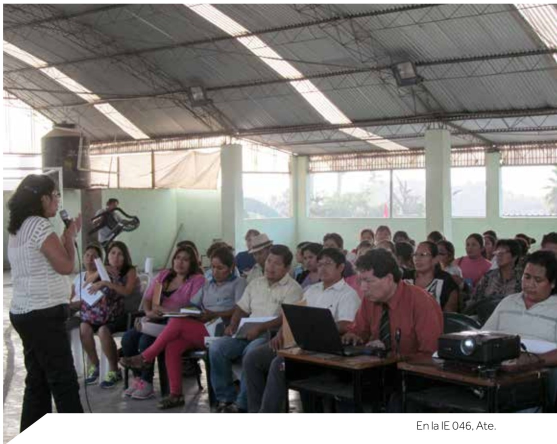
En la IE 046, Ate.