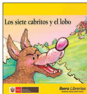
Los siete cabritos y el lobo Grimm, Jacob y Grimm, Wilhelm (2016). Lima: Ibero-A & G, 28 pp.