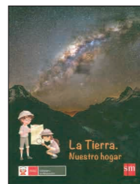
La Tierra, nuestro hogar (2015). Lima: San Marcos, 80 pp.