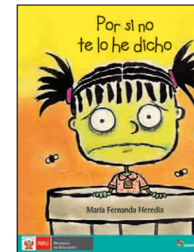
Por si no te lo he dicho Heredia, María Fernanda (2015). Lima: Santillana, 32 pp.

Narra la historia de Lala que muestra con valentía y convicción lo valiosa que es a todos sus familiares y vecinos.