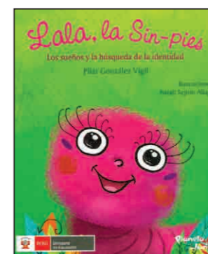
Lala, la Sin-pies. Los sueños y la búsqueda de la identidad González, Pilar (2014). Lima: Planeta, 48 pp.

Cuento adaptado por Margarita Menéndez, que trata de un emperador que fue engañado por unos sastres.