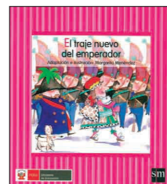
El traje nuevo del emperador Andersen, Hans Christian (2015). Lima: SM, 32 pp.

Narra la historia de una zorrilla que le gusta cantar y cómo su familia termina apreciando su bella voz.