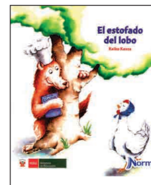
El estofado del lobo Kasza, Keiko (2014). Lima: Norma, 34 pp.

Expone información científica sobre cómo es el planeta Tierra: superficie, interior y elementos que lo componen.