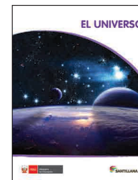
El universo (2015). Lima: Santillana, 56 pp.

Cuenta la historia de un lobo que idea un plan para comerse a una inocente gallina.