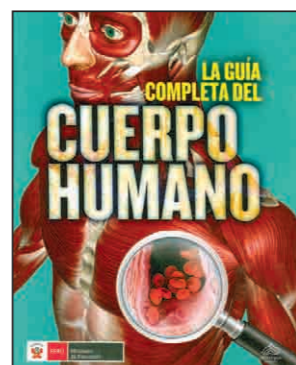
La guía completa del cuerpo humano (2016). México: Advanced Marketing, 150 pp.

Desarrolla información científica sobre el universo y el sistema planetario solar.