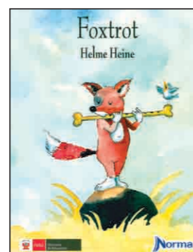
Foxtrot Heine, Helme (2014). Lima: Norma, 32 pp.

Contiene información científica que explica lo maravilloso que es el cuerpo humano.