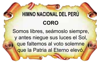
CORO DEL HIMNO NACIONAL