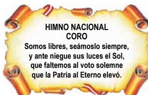
CORO DEL HIMNO NACIONAL