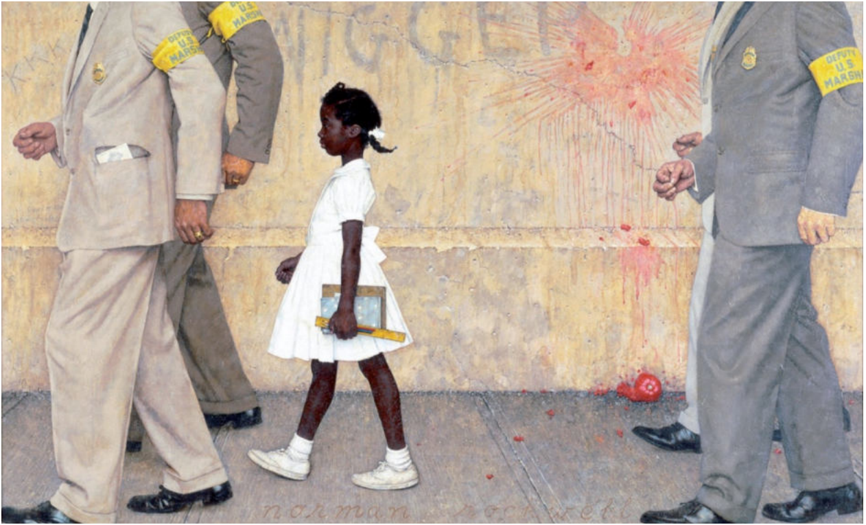
Norman Rockwell (1964). "The Problem We All Live With" (En español: "El problema con el que todos vivimos")