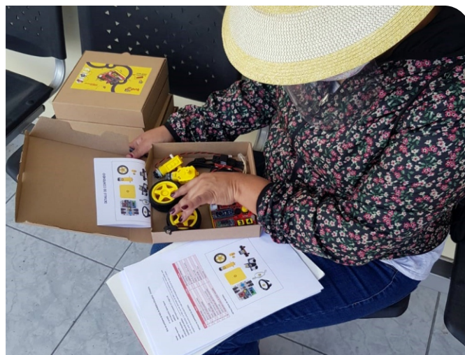
Ccorito, robótica renovada UGEL Arequipa Sur Arequipa