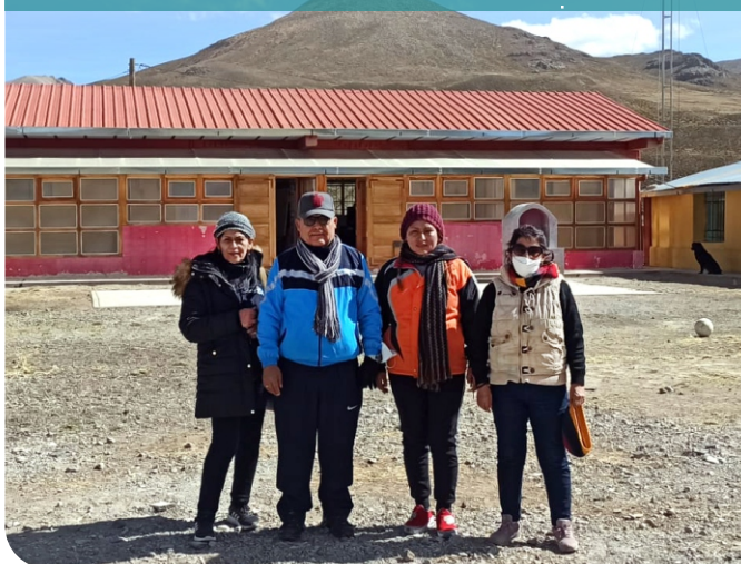
Jumampi contigo en la distancia DRE Tacna