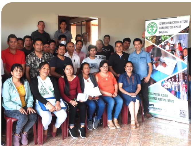
Estrategia educativa Guardianes del bosque DRE Amazonas