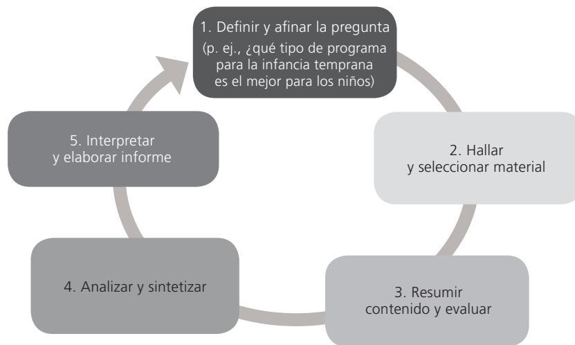
FIGURA 2 Pasos para elaborar una revisión sistemática