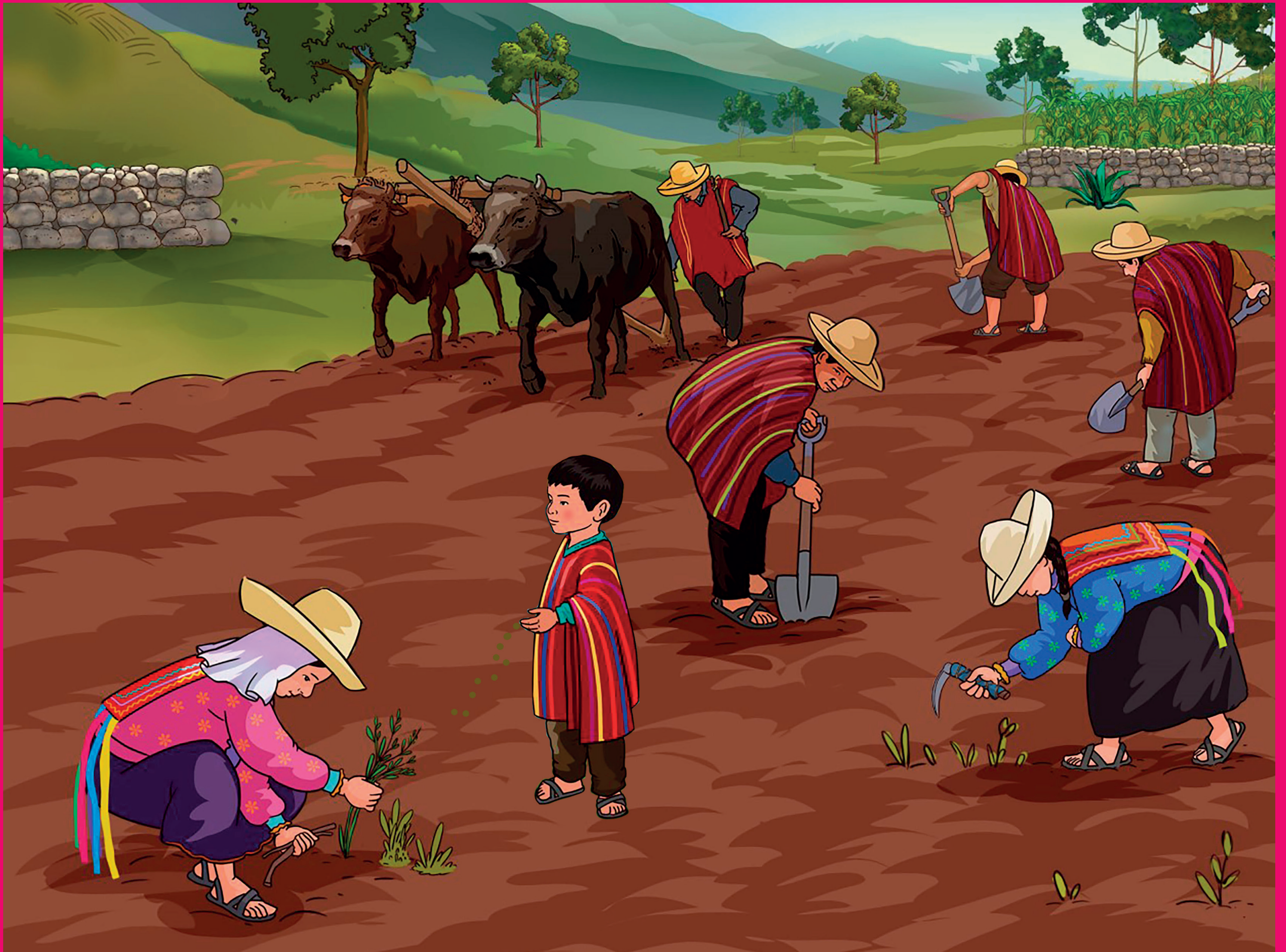
Pueblo originario Quechua norteño (Inkawasi-Kañaris y Cajamarca)