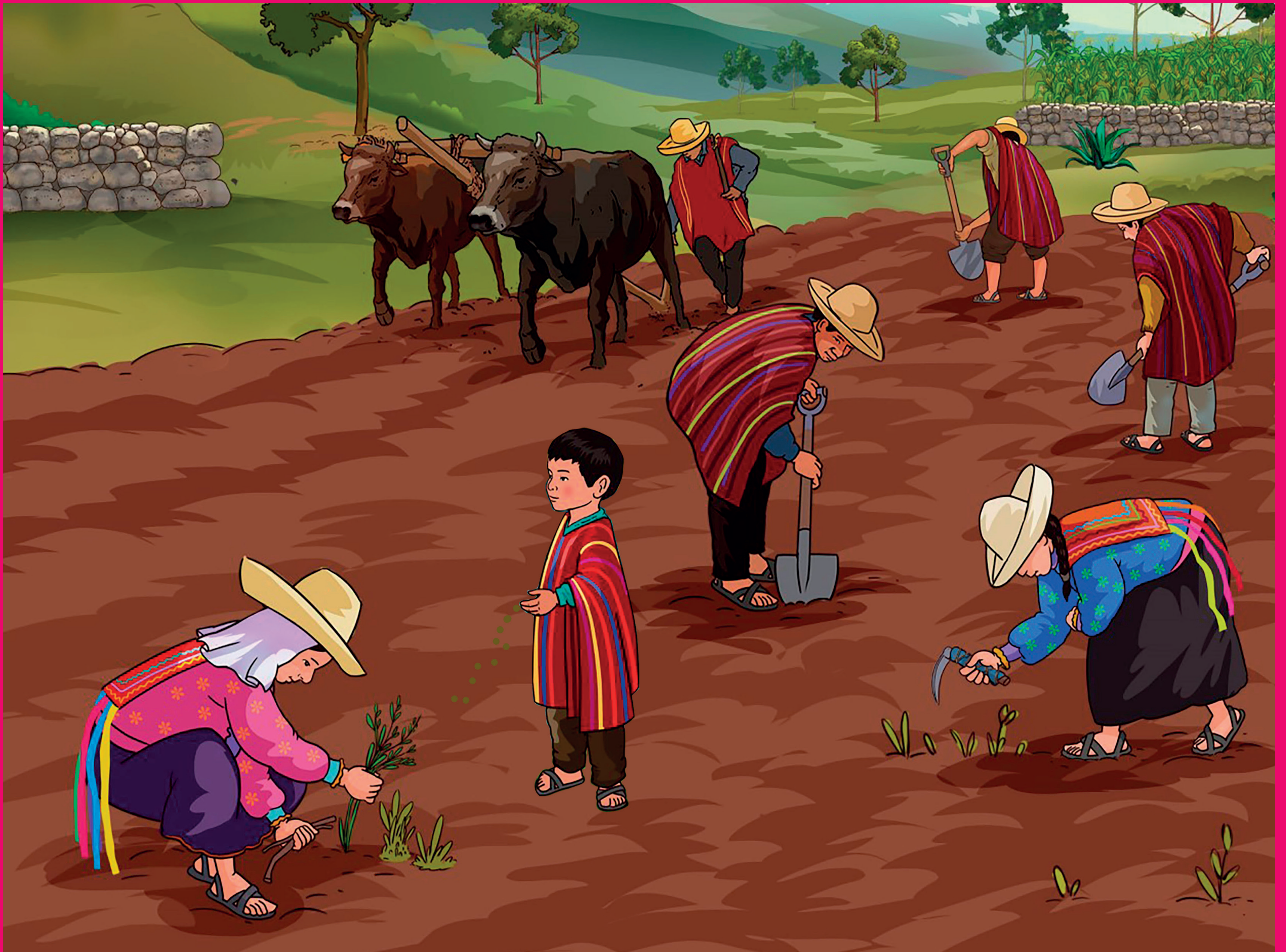
Pueblo originario Quechua norteño (Inkawasi-Kañaris y Cajamarca)