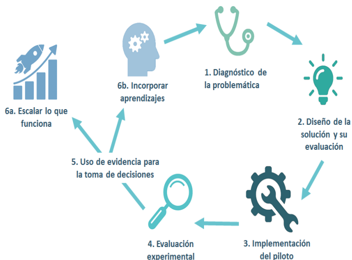
Figura 3. Ciclo de Innovación MineduLAB

MineduLAB es un laboratorio de innovación costo-efectiva para la política educativa que trabaja en la identificación de innovaciones de bajo costo que pueden ser piloteadas y evaluadas recurriendo a data administrativa existente, permitiendo así la innovación y el aprendizaje continuo en la política educativa. MineduLAB es una herramienta gestionada por la Oficina de Seguimiento y Evaluación Estratégica (OSEE) que forma parte de la Secretaría de Planificación Estratégica (SPE). www.minedu.gob.pe/minedulab