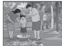
Lámina del pueblo afroperuano