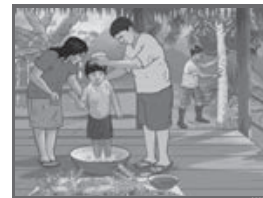
Lámina del pueblo afroperuano