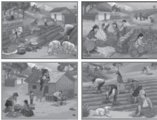
Pueblo Originario Quechua Central