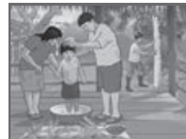
Lámina del pueblo afroperuano