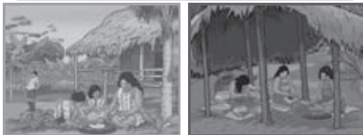
Láminas de pueblos amazónicos