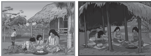
Láminas de pueblos amazónicos