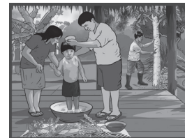
Lámina del pueblo afroperuano