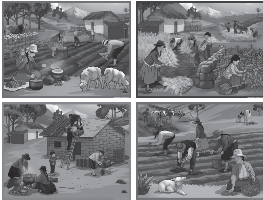
Pueblo Originario Quechua Central