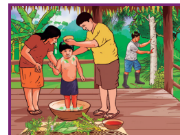
Lámina del pueblo afroperuano