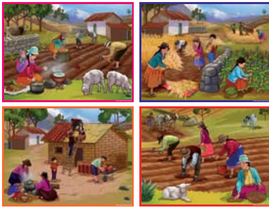
Pueblo Originario Quechua Central