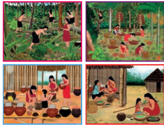
Pueblo originario Wampis