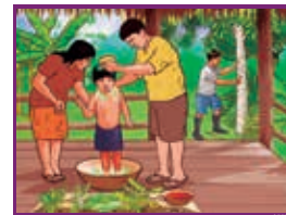
Lámina del pueblo afroperuano