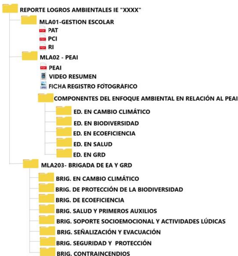
Ilustración 1. ORDEN PARA LA ORGANIZACIÓN DE LAS EVIDENCIAS.