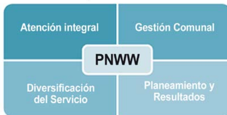
Gráfico 1: Ejes de atención del PNWW

El Wawa Wasi Laboral constituye por ello una iniciativa que atiende a una población muy específica, mujer joven y madre, excluida de formación para el trabajo, con requerimientos de ingresos monetarios inmediatos para mantener a su familia y con necesidad de contar con servicios que respondan a su perfil social.