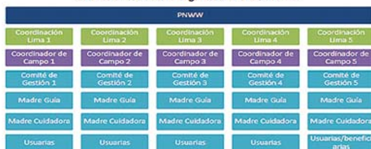
Gráfico 3: Estructura organizacional de PNWW

La experiencia cubrió varias etapas, las que de manera progresiva permitieron alcanzar los objetivos del Programa Piloto.