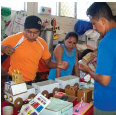
Facilitadores apoyando a los docentes en el desarrollo de materiales en Nicaragua

El acompañamiento pedagógico concebido en la Escuela Activa para asistir y asesorar en forma personalizada al docente, es una forma innovadora de interrogar permanentemente la práctica cotidiana, el desarrollo de capacidades y la relación entre los conocimientos adquiridos. El acompañante realiza un seguimiento en el mismo lugar de trabajo del docente, llegando hasta donde él está, no sólo para responder a sus preguntas, sino para hacer ejercicios reflexivos y ayudar al docente a pensar sobre otras situaciones y preguntas que tal vez no se hace nunca.