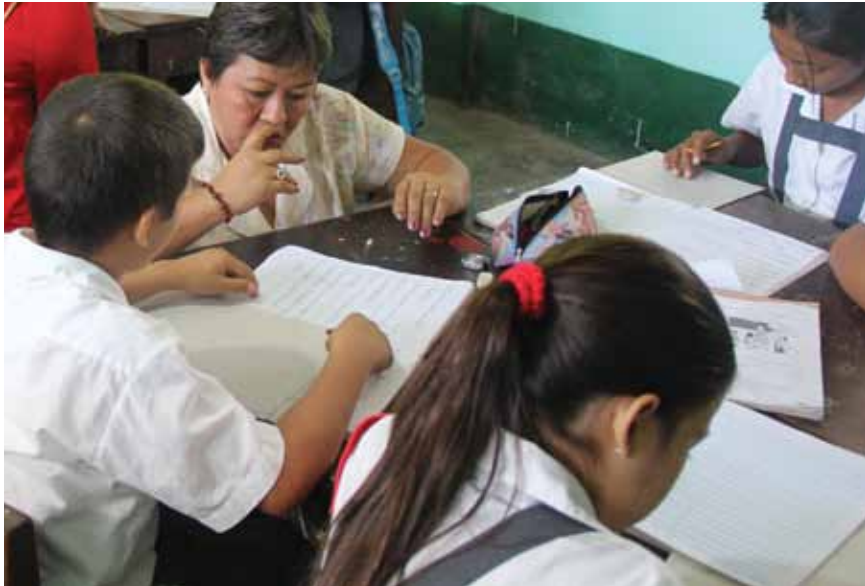
Docente de multi-grado con estudiantes en Nicaragua

que la Escuela Activa es la escuela de las interacciones. En la Escuela Activa hay una permanente reflexión sobre la formación docente en servicio. Hay un cuestionamiento constante a la pregunta ¿Qué puede aportar un docente rural desde su práctica y desde su contexto? Los docentes que encuentran sentido al cambio y pueden demostrar que sus escuelas son activas, son docentes que orientan de manera más cercana a un grupo de docentes de escuelas vecinas. La idea de docentes mentores para otros docentes da origen a una nueva cultura pedagógica para solucionar los problemas actuando juntos frente al aislamiento y las carencias.