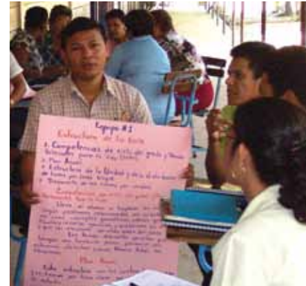
Docentes desarrollando guías de auto-aprendizaje en Nicaragua

Círculos de inter-aprendizaje. Los CIA son espacios de aprendizaje entre y para docentes. En estos espacios se apuesta a crear redes de comunicación de los aprendizajes, promover la ayuda mutua para resolver problemas,