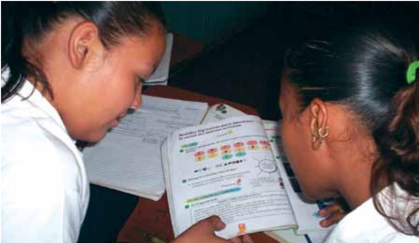
Estudiantes utilizando las guías de auto-aprendizaje en Nicaragua

serie de reflexiones, talleres locales y pasantías a escuelas demostrativas, con el propósito de analizar cómo los diferentes temas de la Escuela Activa se articulan con las diferentes asignaturas y actividades propias de la formación inicial de los futuros docentes. Estas reflexiones se centran en la utilización del APA, en las formas de organizar a los estudiantes para permitir el aprendizaje activo y colaborativo y a la comunidad para participar en el proceso educativo contribuyendo con sus saberes tradicionales. Reflexiones adicionales se realizan alrededor del gobierno estudiantil, del uso de las guías de auto-aprendizaje, el uso de materiales y recursos de entorno, el proceso de lectura y escritura en el primer grado, la evaluación y la promoción flexible, entre otras reflexiones que apoyan la relación entre la teoría y la práctica.