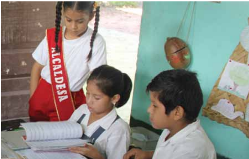
La presidenta del gobierno estudiantil trabajando con sus compañeros en una Escuela Activa en Perú

Los niños y niñas son artífices de su formación en gestión, liderazgo y democracia a través del gobierno estudiantil. La mejor forma de aplicar lo aprendido es simulando situaciones reales o relacionando el aprendizaje con el estilo de vida específico de cada estudiante. La propuesta pedagógica de la Escuela Activa promueve acciones y estrategias que permitan que cada estudiante desarrolle sus habilidades sociales que le permitan vivir en sociedad.