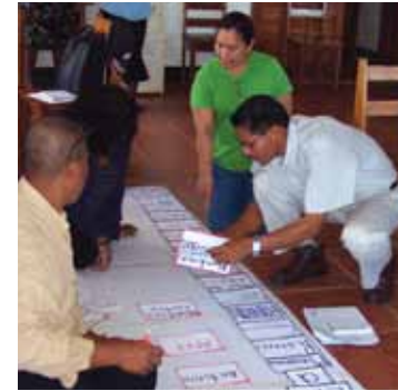
Docentes autores en Nicaragua

Abrir espacios para que los docentes participen es poner a funcionar significativamente el pilar utilizado por el informe Delors: “Aprender a aprender”. En nuestra experiencia formando equipos de docentes pioneros hemos conseguido que desarrollen capacidades para participar como autores de las guías de los estudiantes de segundo y tercer grado. También han desarrollado capacidades para proponer algunos módulos de formación para docentes y especialmente para liderar los proyectos de lectura y escritura para los estudiantes de primer grado. Este proceso de formación ha requerido promover el análisis crítico y reflexivo de las conceptualizaciones y marcos