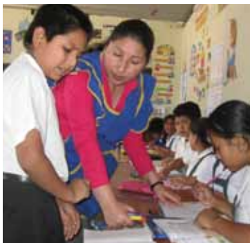
Docente haciendo vivo el currículo en Perú

como pautas orientadoras a docentes, padres, madres y estudiantes. Estos valores integrados a todo el proceso y que están allí casi escondidos pero vivos tienen que ver con: la conservación y uso racional de los recursos naturales, la equidad de género, la ayuda mutua, el respeto y aprecio a las diferencias, los derechos humanos, entre otros. Este proceso que se desarrolla en forma implícita y explícita, es construido con la participación de