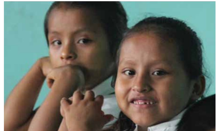
Los estudiantes en una Escuela Activa en Perú

La repitencia de grado y el éxito escolar. En la escuela convencional, muchos estudiantes repiten el grado o pierden el grado cada año. Los padres, los docentes y los mismos estudiantes lo aceptan como algo natural. Es más,