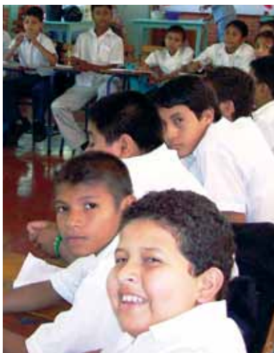
Estudiantes participando en una actividad en el aula en Nicaragua

rurales supera la idea de un diseño de planta física idéntica a la de las ciudades. En la escuela rural se valora más allá de los espacios físicos y se aprende a aprovechar aquellos recursos que antes eran vistos como inapropiados para aprender. A través del aprovechamiento funcional y creativo de los espacios escolares y del entorno se han potenciado estrategias como: “el árbol de la lectura” (leer debajo de un árbol), “el corredor de los experimentos” (utilizar un corredor de la escuela para actividades de ciencia y ambiente), “intercambio de espacio y saberes” (los estudiantes de primer grado se integran a otro grado para escuchar