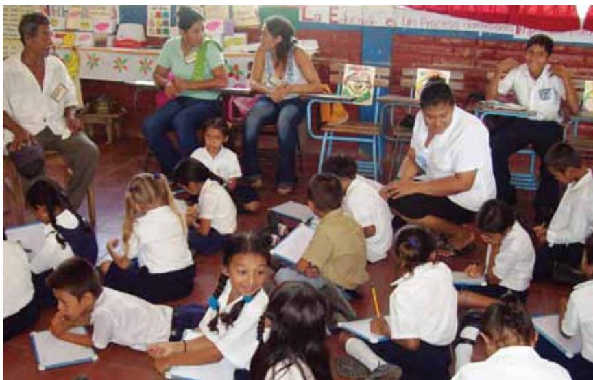
Padres de familia apoyando a los estudiantes en Nicaragua

presencia permanente, ya que se turnan para apoyar al docente en la conducción del proceso. Especialmente, los padres participan en las interacciones, en la consecución oportuna de los materiales y recursos del entorno y en la coordinación con los gobiernos estudiantiles o municipios escolares para desarrollar las actividades dentro y fuera del aula. Evaluaciones externas hechas a la Escuela Activa confirman que los beneficios de la participación de los padres coinciden en: