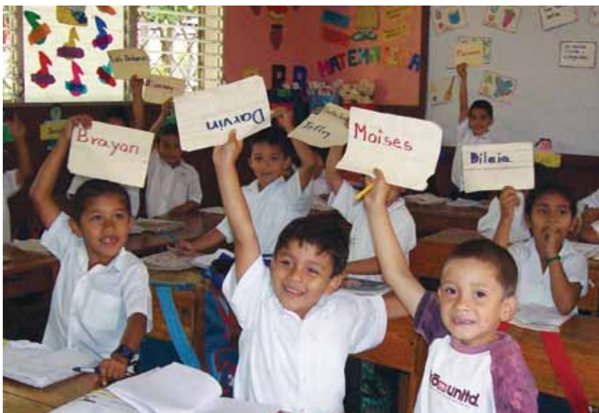
Niños aprendiendo a escribir sus nombres en Nicaragua

Nuestro enfoque para la lecto-escritura. Esta propuesta se sustenta en que los niños y niñas que ingresan al primer grado traen unos aprendizajes de su entorno familiar y social y que es necesario tener en cuenta para enriquecer o completar el proceso de aprendizaje. Al mismo tiempo, se asegura que la lectura no se reduzca a “decodificar”, ni la escritura a “hacer copias”, sino a producir e interpretar textos según sus posibilidades. En el primer grado se tiene como principio que la lectura y la escritura debe presentarse a los niños y niñas sin fragmentarse, tal como aparece en sus vidas: de forma natural, útil y agradable.