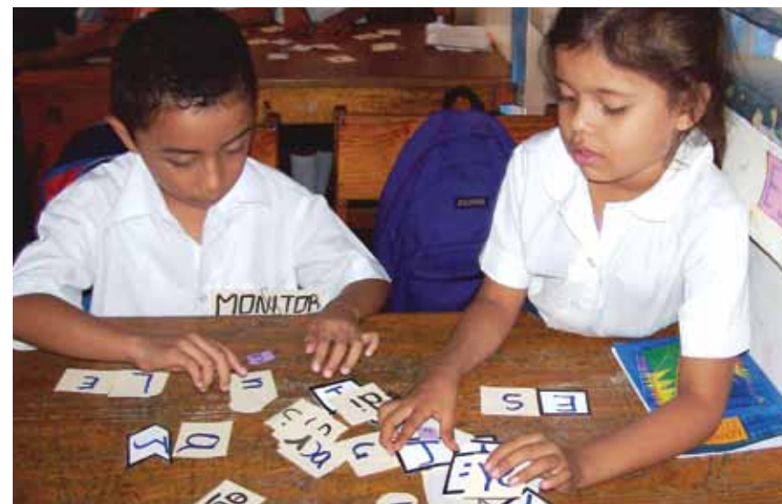
Estudiantes trabajando en grupos pequeños en Perú

Las autoridades educativas aunque manejan el discurso actualizado de la nueva educación, muchos en la práctica no han superado la vieja concepción de la educación y de la escuela, y en algunos casos siguen tratándola como reproductora de procesos educativos. Difícilmente las autoridades promueven que los docentes de las zonas rurales reinventen su escuela