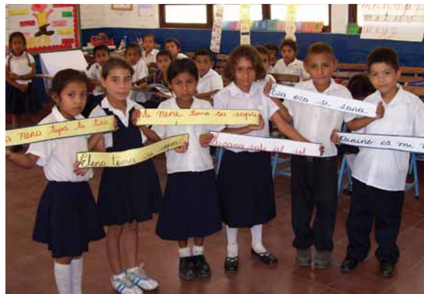
Estudiantes utilizando recursos locales para aprender a leer y escribir en Nicaragua

El uso adecuado del tiempo que dispone un estudiante de la zona rural para asistir a la escuela, obliga a la vez, a dejar atrás el concepto de repetición de grado o aplazamiento, para abrir un espacio a una evaluación justa. El tiempo se dedica a ayudar al estudiante a descubrir sus potencialidades y a encontrar estrategias para avanzar en sus logros, para fortalecer su autoestima y su autonomía. La Escuela Activa parte del principio que lo importante no es la cantidad de horas del estudiante sentado en el aula, sino la calidad de sus aprendizajes y el tiempo que le toma alcanzar las metas esperadas en las asignaturas y contenidos. Por esto, permite la promoción al grado siguiente en cualquier época del año escolar, cuando el estudiante alcance los logros esperados en cada asignatura o grado previstos en las guías de auto-aprendizaje.