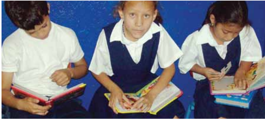
Estudiantes leyendo en una Escuela Activa en Nicaragua

Para facilitar la aplicación de la teoría a la práctica, se utilizan casos de la vida real para plantear problemas y hacer que el niño use lo práctico para entender lo abstracto. Esto se convierte en un aprendizaje natural que es aplicable al ambiente inmediato del niño o niña. Para completar el proceso, todo lo que se aplica se comenta de vuelta en la escuela, ya sea con los compañeros o con el docente o la docente. Se trata de encontrar el equilibrio práctico entre el “saber” el “saber hacer”, y el “saber ser”. Más aún, en cooperación con sus compañeros y con el andamiaje que les ofrece el docente, cada niño y niña tiene la oportunidad de descubrirse a sí mismo, en relación con los demás; aprende a analizar, a confrontar, a experimentar y a reflexionar permanentemente. Finalmente, lo que se practica, se aplica en la comunidad o en la casa con la familia. Es en ese momento en que los padres de familia tienen oportunidad de apoyar los procesos de aprendizaje.