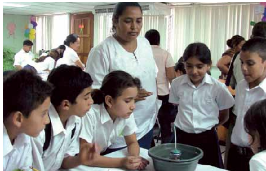
Estudiantes realizando experimentos en clase en Nicaragua

La Escuela Activa desarrollada en cada país, ha buscado caminos para apoyar a las escuelas y a las comunidades en el manejo de algunos recursos