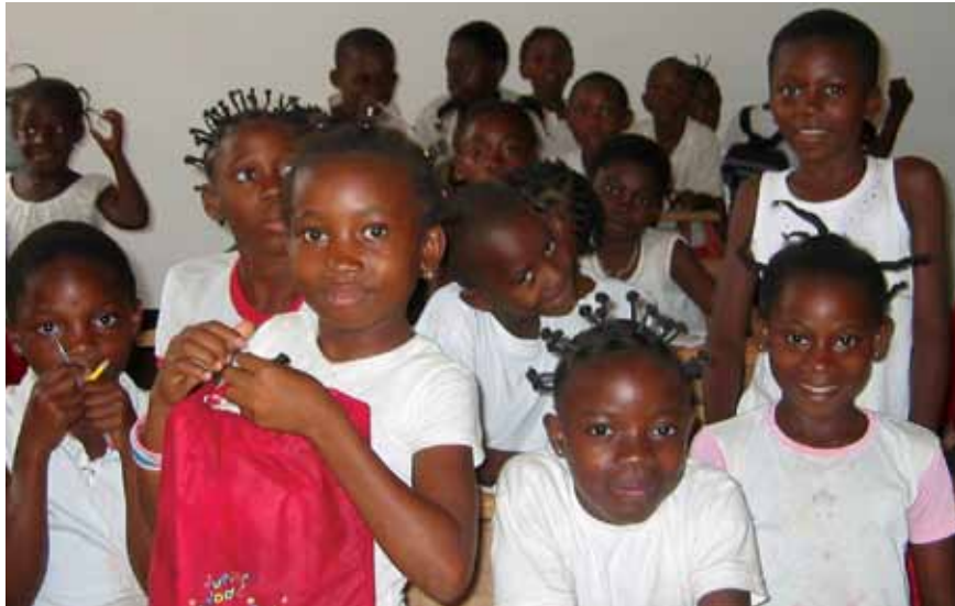
Estudiantes en Guinea Ecuatorial

permanente, la formación de valores y actitudes que hace más estrecha su relación con el currículo. Las normas, conductas y valores promovidos en las guías, fortalecen el sentido de equidad y responsabilidad entre los niños y niñas. Una vez que se interiorizan estos principios, los niños y niñas son capaces de romper los falsos estereotipos que surgen en la sociedad y sus paradigmas cambian de forma positiva. Los valores se trabajan en forma vivencial y permanente.