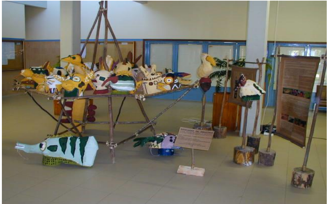
Figura 3 Exposição Final das Máscaras

O facto de se usarem materiais reciclados para construir as máscaras, permitiu aos alunos compreender que podem reutilizar objectos do quotidiano que, normalmente, não valorizam e jogam ao lixo. As crianças confrontaram-se com formas de arte de outros continentes, com características estéticas e tecnológicas diferentes das da arte ocidental e reflectiram sobre o simbolismo de artefactos e as relações ao nível do design e respectiva função. Ao convidar os seus alunos a olhar objectos da cultura material, o professor estabeleceu relações entre a arte e a antropologia e reflectiu sobre estereótipos culturais relacionados com grupos étnico - minoritários e a utilização indevida do conceito de ‘primitivo’. As actividades relacionadas com crítica de arte e ensino interdisciplinar foram consideradas ‘uma via natural’ para ajudar os estudantes a encontrarem o ‘outro’ e a viverem caminhos culturalmente diferentes de estarem no mundo.