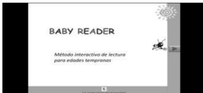
Figura 1. Pantalla principal del programa Baby reader , realizada con imágenes de internet.

La imagen, sonido y video: son agradables y coloridos para llamar la atención de los pequeños, quienes se motivarán al observar las pantallas agradables, los videos divertidos, las imágenes y los sonidos acordes a su imaginación (Figura 1.). Es importante mencionar que las imágenes retomadas se bajaron de internet y que es posible que contengan derechos de autor, por lo que solamente en este prototipo se utilizaron como muestra. Para la versión final las imágenes serán diseñadas por el autor y registradas con el programa (Figura 2.).