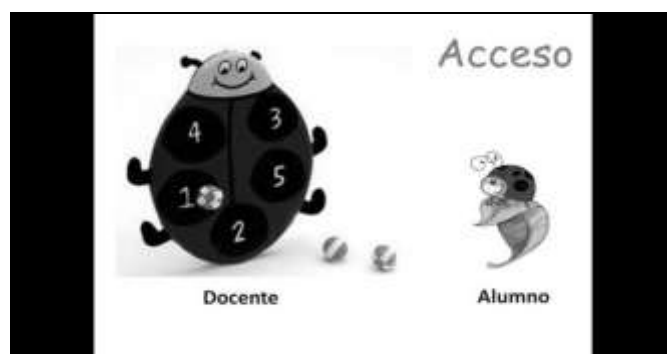
Figura 2. Pantalla de acceso para docentes o alumnos del programa Baby reader , realizada con imágenes de internet.

Entre los aspectos funcionales, es importante considerar las necesidades de los usuarios al momento de utilizar el prototipo, tanto de los docentes que son quienes lo incorporarán al aula, como de los alumnos que recibirán la información (Gómez Zermeño, 2012).. El diseño del prototipo contiene menús claros y precisos para iniciar cada sesión de lectura, los cuales están distribuidos por el número de sesiones que debe contener cada semana y las sesiones a impartir durante el día, por lo que el docente o el niño únicamente deben seleccionar el día que corresponde con el mouse para acceder a las sesiones de lectura de ese día. Una vez dentro, las sesiones están enumeradas de tal manera que el docente puede ir anotando en su cronograma de trabajo el número de la sesión que corresponde, en un futuro el niño podrá hacer esta tarea siendo su aprendizaje completamente autónomo (Figura 3).