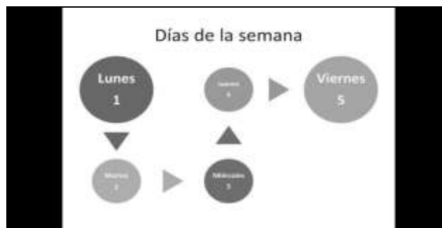
Figura 3. Pantalla de los días de la semana del programa Baby reader . (De autoría propia).

Como parte adicional del prototipo, se presenta una sección de documentación adicional en donde se propondrá a futuro una URL para acceder por medio de internet a contenidos más actualizados y documentos de apoyo. Se incluye un archivo que especifica las características básicas del material, un manual de usuario que describa las funciones del prototipo, un cronograma de actividades registrar avances y un instructivo. En la versión final, se piensa incluir un manual adicional de actividades lúdicas para reforzar la enseñanza de la lectura.