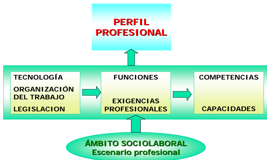
Figura 2. Elementos configuradores de un perfil profesional

No vamos a entrar en el detalle de la articulación del perfil docente, sus procedimientos y el papel de los actores sociales en su acotamiento, como ya hemos insinuado. Tampoco queremos referirnos a un perfil específico en concreto, sino sencillamente dar algunas claves para futuras conformaciones de perfiles profesionales de acuerdo a esta doble lógica que posibilita el escenario sociolaboral: las funciones y las competencias.