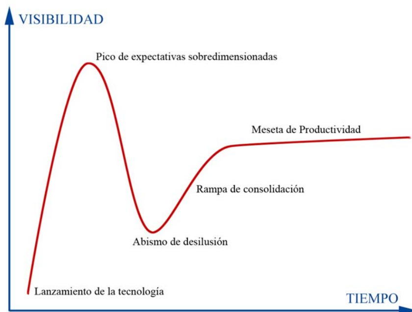
Figura 1. Ciclo de sobreexpectación de las tecnologías según Gartner

Pero, independientemente de la postura que se adopte al respecto, lo que sí es cierto, es que en la actualidad los MOOC se encuentran en la cresta de la ola de la conocida gráfica que la compañía Gartner propuso respecto al Hiper ciclo de aceptación de cualquier tecnología, y que pone claramente de manifiesto que la admisión de cualquier tecnología no es nada estable, y pasa por diversas fases y momentos (figura 1).