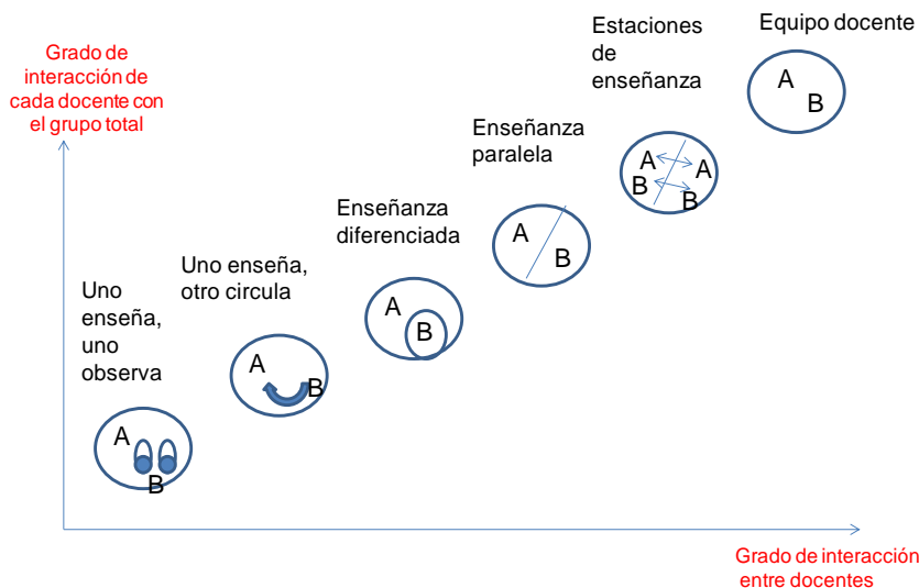
Figura 1. Distribución de los enfoques de co-enseñanza en función de la interacción entre los agentes involucrados