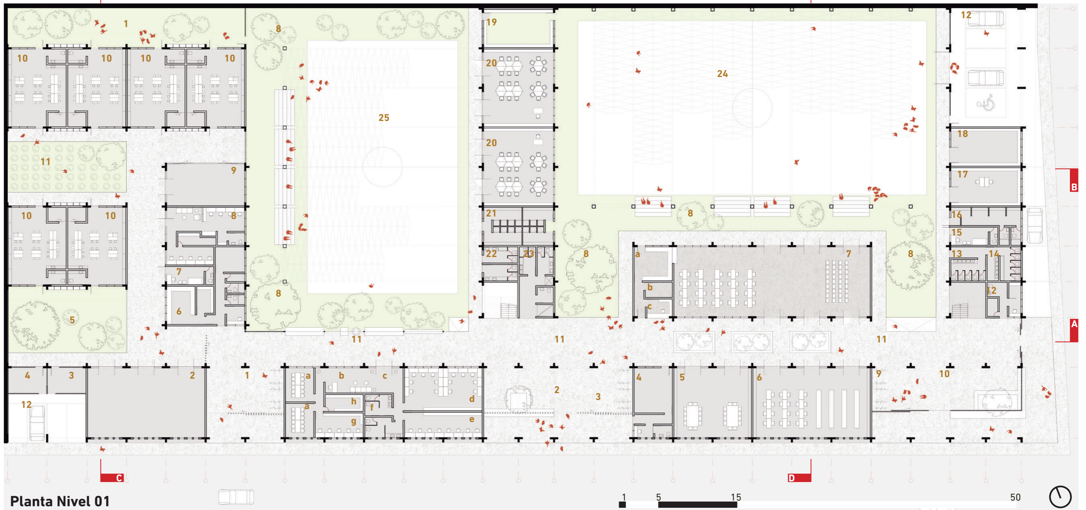
Planta Nivel 01