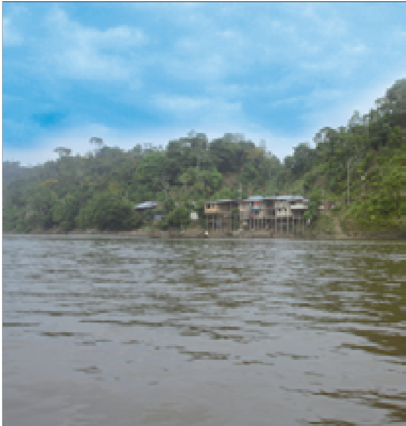
Río Nieva - Condorcanqui.