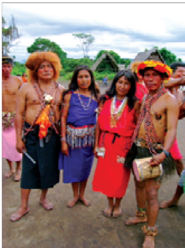
Grupo Comunidad Nativa de Shampuyacu. Región San Martín.