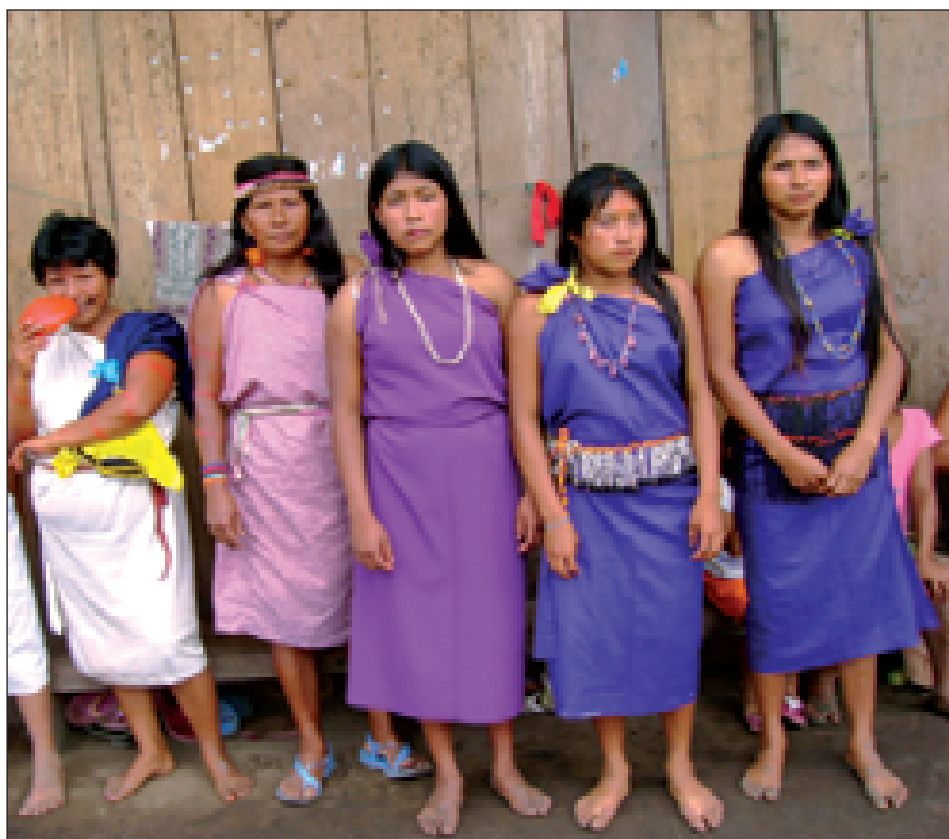
Mujeres Comunidad Nativa de Shampuyacu Región San Martín.