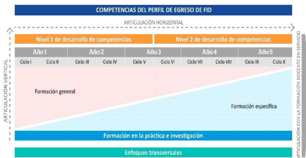
Figura 4 Articulación horizontal y vertical del DCBN de Formación Inicial Docente

El currículo de Formación Inicial Docente implica la articulación de cursos y módulos para la formación desde los diferentes componentes curriculares como condición para alcanzar los niveles de competencia esperados. En ese sentido, el proceso de construcción del DCBN responde a la necesidad de mantener una visión sistémica y coherente en el desarrollo de competencias a lo largo del plan de estudios (UNESCO, 2016b; Tobón, 2013). Para asegurar la coherencia entre los distintos componentes del currículo, se proponen dos tipos de articulación: i) la horizontal y ii) la vertical.