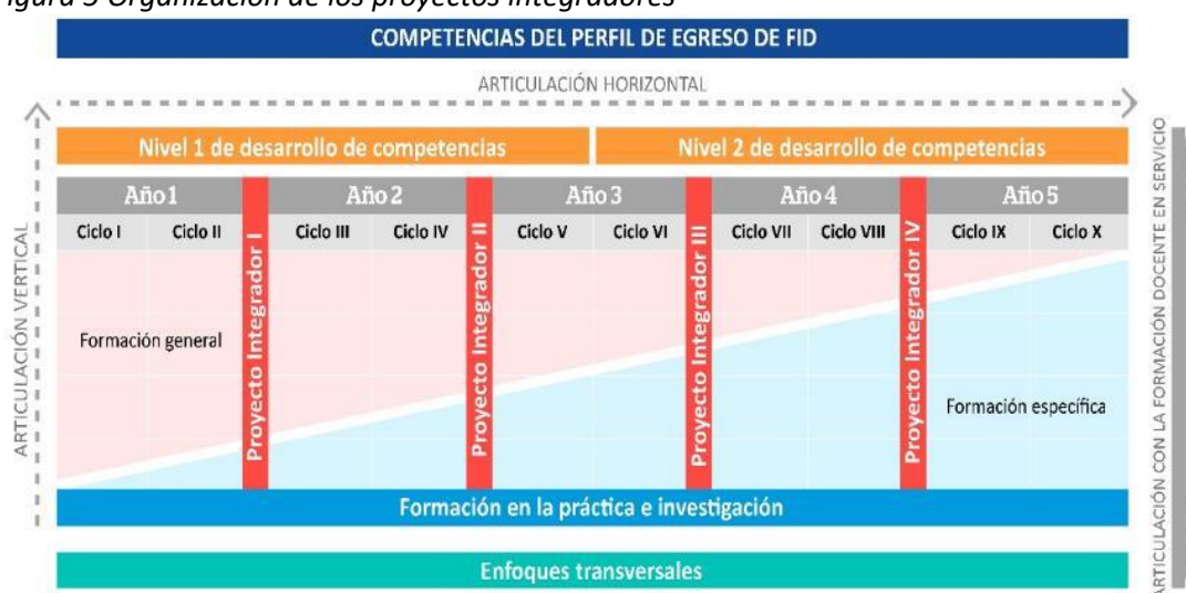
Figura 5 Organización de los proyectos integradores