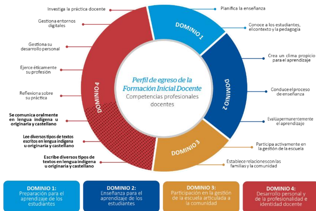
Figura 1 Esquema del Perfil de egreso de la Formación Inicial Docente