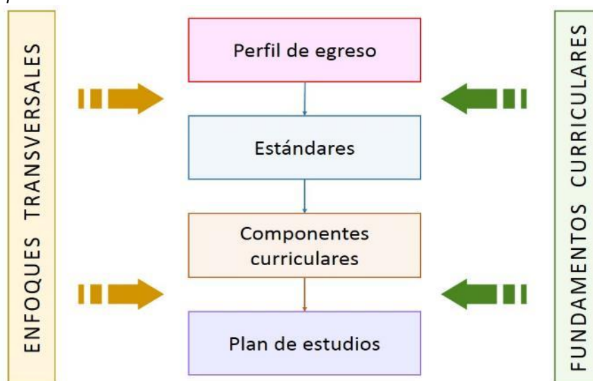
Figura 2 Esquema del Modelo Curricular de la Formación Inicial Docente

El modelo curricular responde a una concepción sistémica que articula las políticas y objetivos establecidos para el sector Educación. Considera las demandas del Currículo Nacional de la Educación Básica, del Marco de Buen Desempeño Docente, así como del Proyecto Educativo Nacional. Por ello, sustenta las decisiones tomadas en la elaboración, organización y articulación de los elementos del DCBN, comunica cuáles son los puntos de partida, cómo se relacionan sus elementos y cuál es su énfasis en la formación de estudiantes de FID.