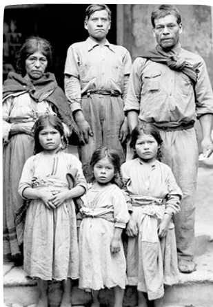
Figura 1. Retrato de familia campesina, 1940 (como se cita en Alejos, 2001, p. 33)

Este ejemplo ha sido adaptado de Koc-Menard (2017, p. 130). Aquí la autora incorpora un elemento visual que ha recuperado externamente de otra fuente, específicamente de la página 33 de Alejos (2001). En el apartado bibliográfico, se registrará la referencia bibliográfica correspondiente a esta fuente.