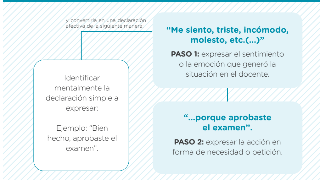
Gráfico N.º 2 Estructurando declaraciones afectivas para desaprobar conductas 5