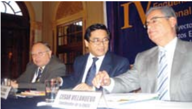
Ministro José Antonio Chang, el presidente de la ANGR, César Villanueva, y el presidente del CNE, Andrés Cardó en IV Encuentro CNE- Regiones.

Regiones. El CNE ha fortalecido los espacios de intercambio sobre implementación y articulación de los proyectos educativos regionales (PER) y el Proyecto Educativo Nacional, en diálogo con los gobiernos regionales y los consejos participativos regionales- COPARE, y sus equipos técnicos o grupos impulsores. A su vez ha alentado y difundido los avances y logros en la implementación de los proyectos educativos regionales y algunos proyectos locales.