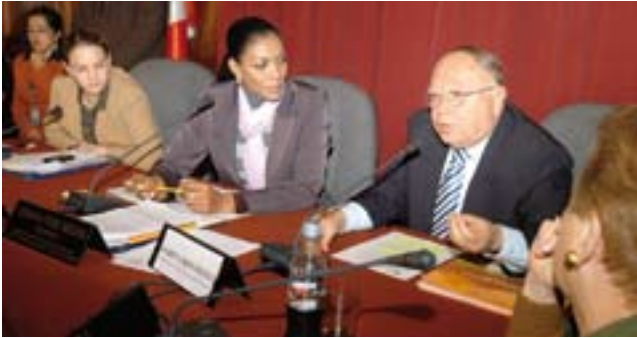
Presidente Cardó expone en comisión de Educación del Congreso de la República.

Regiones. El CNE ha fortalecido los espacios de intercambio sobre implementación y articulación de los proyectos educativos regionales (PER) y el Proyecto Educativo Nacional, en diálogo con los gobiernos regionales y los consejos participativos regionales- COPARE, y sus equipos técnicos o grupos impulsores. A su vez ha alentado y difundido los avances y logros en la implementación de los proyectos educativos regionales y algunos proyectos locales.