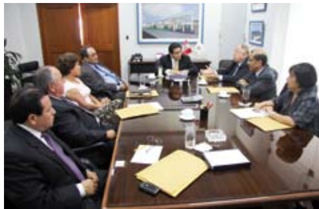
Comité directivo del CNE en reunión con ministro José Antonio Chang en marzo de 2009.

El Comité Directivo planifica, ejecuta, controla y evalúa las acciones del Consejo y tiene funciones de representación, de decisión y de gestión institucionales.