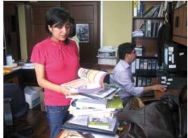
Equipo técnico del CNE en jornada de trabajo.