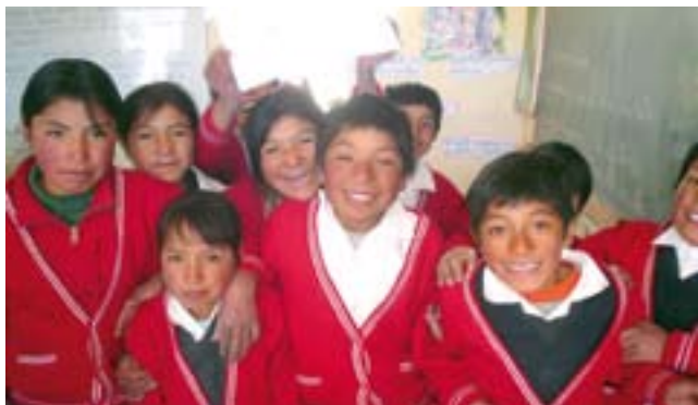
Escolares de escuela en Castrovirreyna.

La Comisión de Descentralización, Gestión y Financiamiento tiene entre sus objetivos fortalecer el espacio de diálogo y concertación entre regiones y a la vez con las instancias nacionales para el impulso a la implementación de los Proyectos Educativos Regionales, así como elaborar lineamientos para la reestructuración de las instancias de gestión nacional, regional y local (2008–2010) en función al fortalecimiento de la institución educativa.