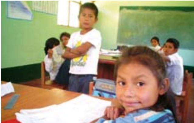
Escolares en escuela de programa de IPAE.

La comisión Educación Básica y Desarrollo Magisterial busca entre sus objetivos, contribuir a las políticas de desarrollo profesional docente en el marco de la Carrera Pública Magisterial, así como a las políticas de calidad y equidad para la Educación Básica, en especial para la escuela rural, en la perspectiva planteada en el Proyecto Educativo Nacional.