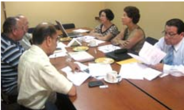
Comité Directivo y secretaria ejecutiva en reunión.