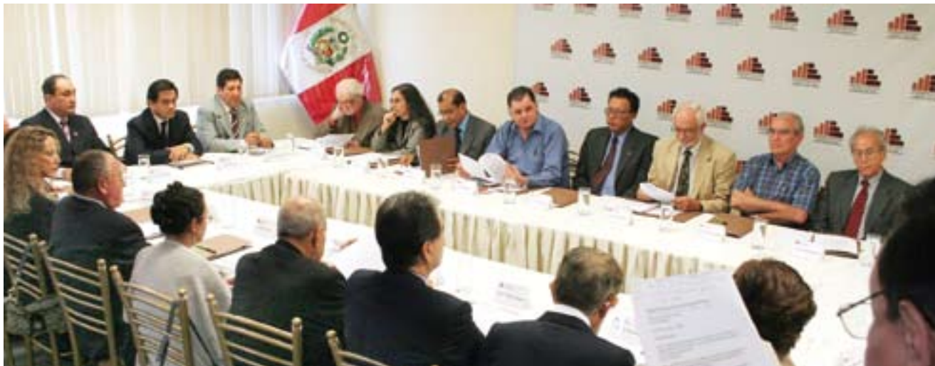
Instalación del Consejo Nacional de Educación 2008-2014