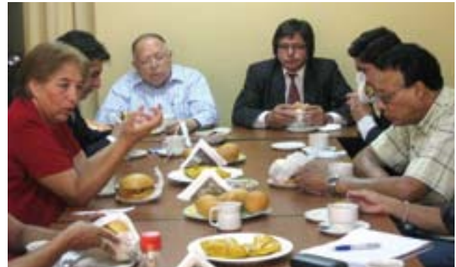
CNE reunido con nueva directiva del SUTEP

El CNE participó también en la mesa redonda “Cómo Articular el Proyecto Educativo Nacional a la Acreditación de la Calidad y a los Perfiles Profesionales”, organizada por la Derrama Magisterial, que fue clausurada por el presidente del Consejo Nacional de Educación.