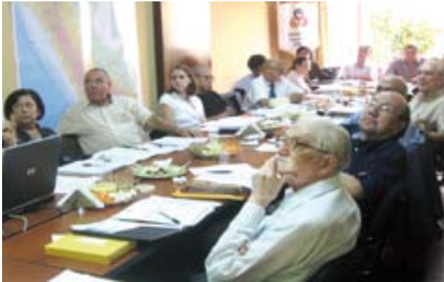
Consejeros en pleno

El CNE está integrado por personalidades especializadas y representativas de la vida nacional, seleccionadas con criterios plurales e interdisciplinarios, designados a título personal por el Poder Ejecutivo: