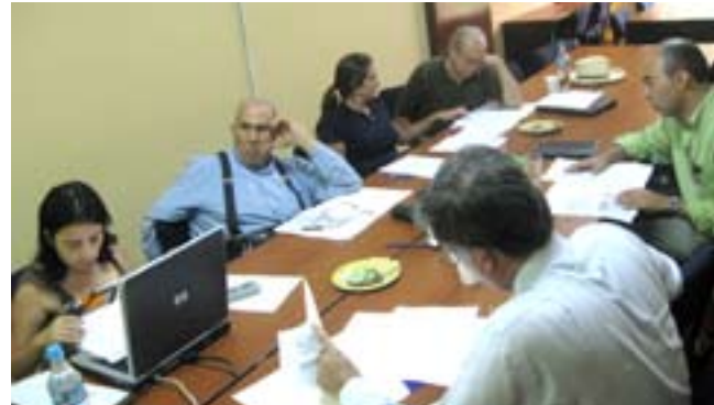
Comisión de educación superior en pleno trabajo.

Para el análisis de temas como la organización, funcionamiento y gestión de sistemas de educación superior; las tendencias globales de reforma; las políticas educativas asociadas a la economía, el empleo, la competitividad, la productividad y globalización, la comisión ha realizado una serie de diálogos