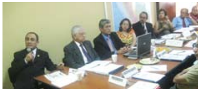
Viceministro Idel Vexler y funcionarios del MED en visita al pleno del CNE

Ministerio de Educación. El CNE ha mantenido una comunicación constante con el Ministerio de Educación sobre políticas y medidas adoptadas o proyectadas por el sector. Ha puesto en evidencia su preocupación por temas coyunturales y por la necesidad de forjar consensos de largo plazo alrededor de las políticas del sector. En el campo de la evaluación de políticas, el CNE ha cumplido su función de emitir opiniones de oficio y ha elaborado aportes a pedido del Ministerio. No siempre las opiniones del Consejo fueron tomadas en consideración.