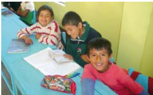
Estudiantes en una escuela de San Ramón (cortesía IPAE).

Se ha aportado a la implementación de la nueva Carrera Pública Magisterial, así como a una política de evaluación docente que pueda articularse a la política de formación y desarrollo profesional de los maestros y, por lo tanto, que enfoque fundamentalmente la calidad de su desempeño en el aula.