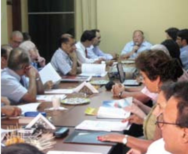
Consejeros en sesión plenaria

Los nuevos miembros del Consejo Nacional de Educación (CNE) fueron designados el 22 de marzo mediante Resolución Ministerial N° 194-2001-ED, y elegidos tras sugerencias, propuestas y opiniones provenientes del Estado de la sociedad civil, por sus méritos y calidad profesional vinculada a la educación.