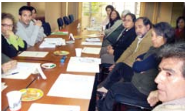
Expertos y equipo técnico en reunión de Mesa Interinstitucional.

Para el año 2009 sus metas son: construir un sistema de información sobre el proceso de implementación de los proyectos educativos regionales y la descentralización educativa e impulsar el fortalecimiento de las relaciones con las regiones.