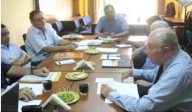
de fin de año, lo que nos permitirá contar con una evaluación