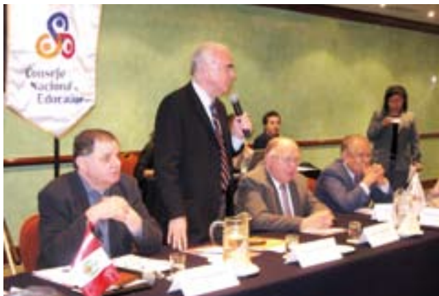
Ex ministro brasileño Paulo Renato Souza en conferencia.

La comisión tiene como objetivos desarrollar una visión sobre escenarios futuros deseables para la educación peruana, para aportarlos al país en consonancia con el Proyecto Educativo Nacional (PEN).