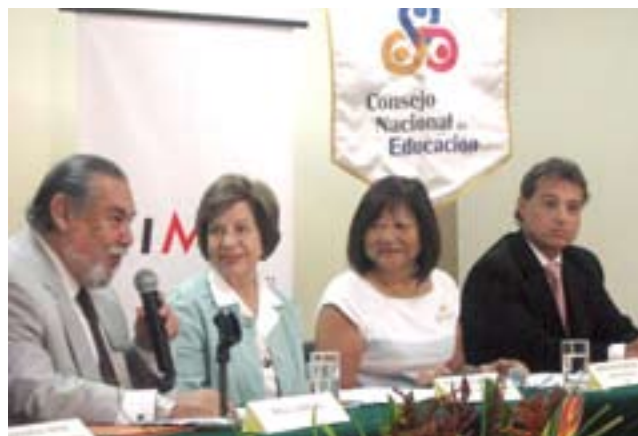
Lanzamiento de campaña del CPAL con apoyo del CNE.